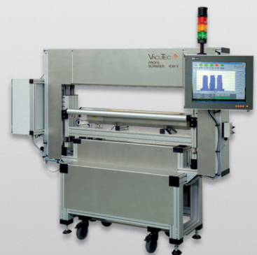
ICW system/ Profils scanner