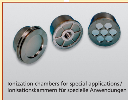
Ionization chambers for special applications / Ionisationskammern für spezielle Anwendungen

Shown on this and the next page are the available basic types of ionization chambers for industrial applications. The area mass measuring range is defined by the used source. All chambers can be operated with different nuclides and X-ray energies, limited by the used window foils, the gas filling and the gas pressure.